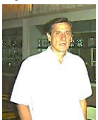
*Director del Instituto Anatómico de Córdoba y Museo Pedro Ara Profesor Titular Catedra de Anatomía Normal. FCM-UNC. 2016

Antes de terminar, quiero agradecer la presencia de todos ustedes, especialmente a los familiares de los profesores que ya no nos acompañan, pero también quiero agradecer como profesor titular y director de este querido museo, que me enorgullece como cordobés y argentino, a todo el equipo que hoy me acompaña, docentes, no docentes y ayudantes, vaya para todos ellos mi profundo reconocimiento.