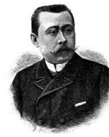
Jean Leo Testut